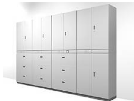
<セキュアシンライン・概観>