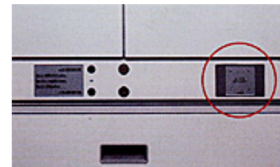
<表示パネル・カードリーダー部>